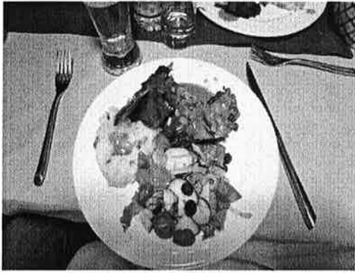
レストランの食事のメニューは相変わらず肉料理

バスを降りた。生徒は、信大留学が夢だと言ったという。15：00 自然史博物館着。学芸員が館内を案内してくれた。かなり広く、歩いて回るだけで疲れてしまう。 17：00 ホテル着。スーパーへ買い出しをする団員もいた。 19：00 レストランへ。やはり、まづサラダ、肉のプレート。肉の出来ない食事はない。 27日(日) 市内観光・ショッピング 7：00 朝食の時間になっても「lose」。5分過ぎても開く気配がない。入って「OK?」と聞くと「OK!」。 9：50 スーパーとトル広場へ。ガイドから広場周辺の建物の説明を受ける。軍のイベントが行われるそうで、赤いジャケットが敷かれ、笑顔の勲章を着け軍人が多数いた。 10：12 ノミンデパート着。1階の